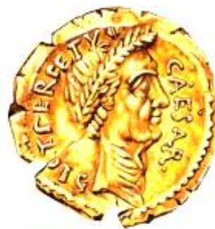
Aureus, mince zavedená v době Caesara na celém území říše.

Caesar neposlechl svou ženu Calpurnii [kalpurnyji] a přes její varování se vypravil do senátu. Tam byl zavražděn odpůrci vlastní samovlády. Společně mu zasadili 23 bodné rány, z nichž jen jedna byla smrtelná. Mezi těmi, kdož se rozhodli zbavit diktátora byl i Caesarův adoptivní syn Brutus . Překvapený Caesar se na něj údajně otočil se slovy: I ty, Brute?